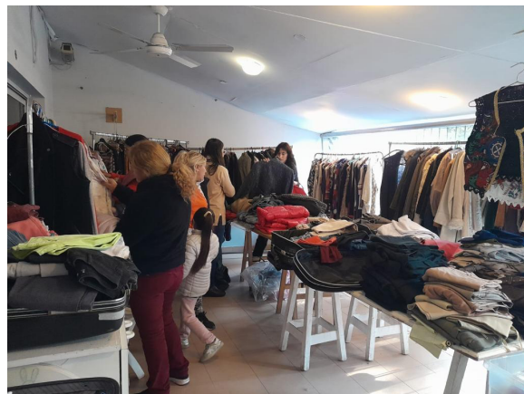
Ferias mensuales actuales en ACER SI- invasión de espacios